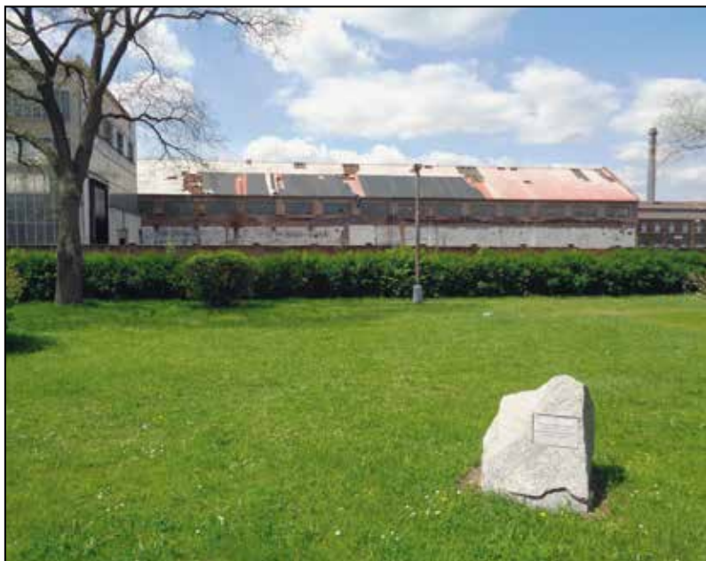
Holýšov – pamětní kámen na místě tábora chorvatských válečných zajatců, v pozadí areál bývalé muniční továrny.

zde byla instalována v roce 2005, předtím byla přímo na zdi umístěna pamětní deska s podobným textem v šesti jazycích – oproti současné variantě chyběla angličtina a nizozemština. 5)