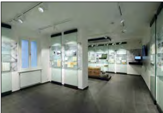
Pohled do expozice „Terezínské transporty“.