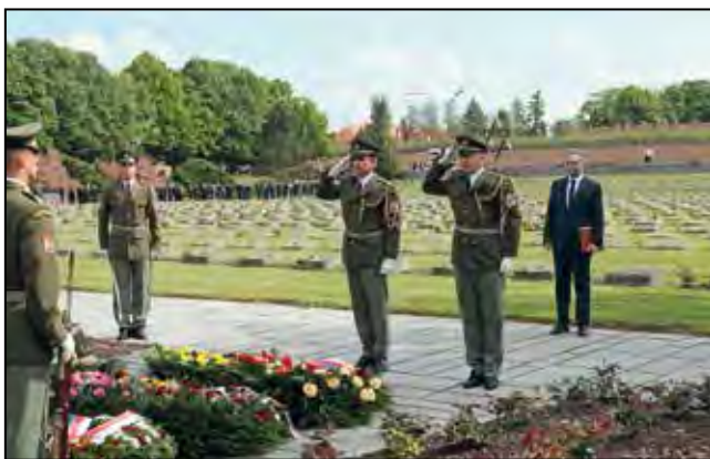
Tereziánská tryzna 2019, kladení věnců na Národním hřbitově.

Na Národním hřbitově se konala tradiční Tereziánská tryzna za účasti zástupců Senátu Parlamentu České republiky, Poslanecké sněmovny Parlamentu České republiky, vlády České republiky, zastupitelských úřadů mnoha zemí a dalších hostů. Hlavní projev přednesl Jaroslav Kubera, předseda Senátu Parlamentu České republiky.