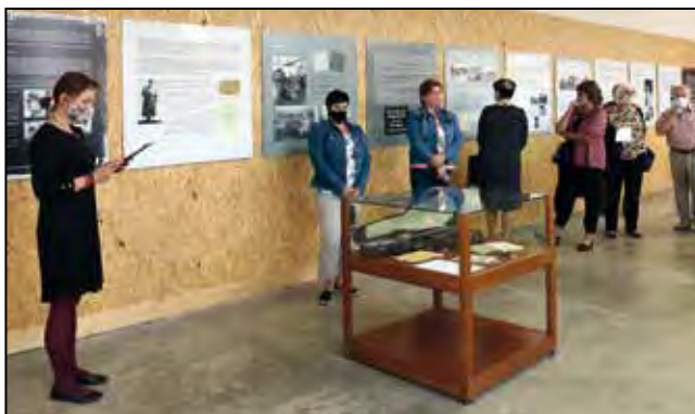
Vernisáž výstavy „80. výročí zřízení policejní věznice gestapa v Terezíně“.

Ve výstavních prostorách IV. dvora Malé pevnosti byla zpřístupněna dokumentární výstava „80. výročí zřízení policejní věznice gestapa v Terezíně. Historie nacistického represivního zařízení ve světle dokumentů a vzpomínek vězňů“.