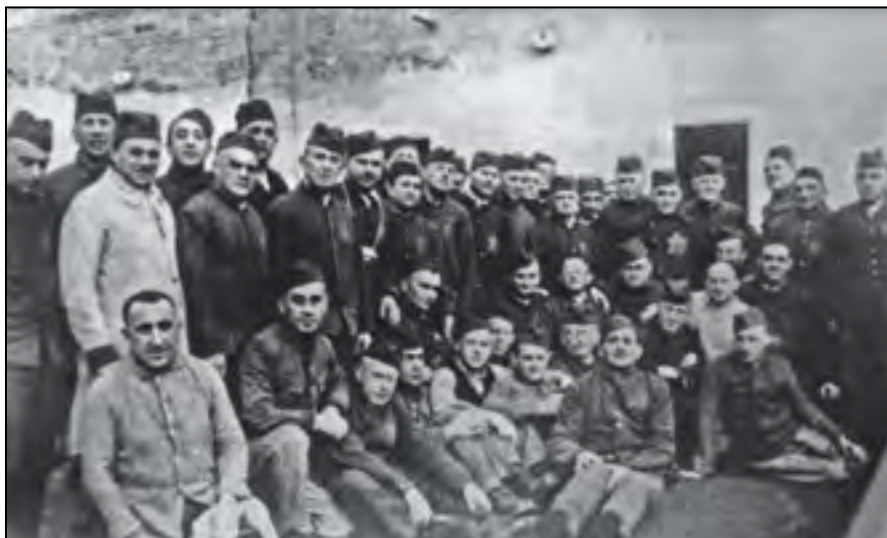
Skupinová fotografie 44 Židů, členů plzeňské odbojové skupiny. Do Terezína byli předáni 22. prosince 1940.