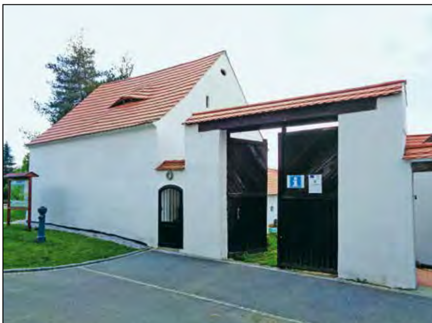
Holýšov – vstup do areálu Domu dějin Holýšovska.

Samotný statek v Novém Dvoře není veřejnosti přístupný, pietní místo je však předmětem pravidelných vzpomínkových akcí včetně návštěv ze zahraničí. Z nejvýznamnějších lze uvést návštěvu bývalých vězeňkyň tábora v roce 1967, pozůstalých po francouzských věznicích v roce 2016, 8) veteránů 17. belgického střeleckého praporu v letech 2008, 2014 a 2016 nebo v roce 2015 návštěvu členů Svazu vojáků Národních ozbrojených sil, který udržuje odkaz polského odbojového hnutí. O rok později byla na pietním místě přítomna i velvyslankyně Polské republiky v ČR Grażyna Bernatowicz. 9) Kromě mimořádných návštěv jsou holýšovské oběti vzpomínány při pravidelných pietních aktech a bývalý tábor je tak i v současnosti v obecném povědomí obyvatel města. 10)