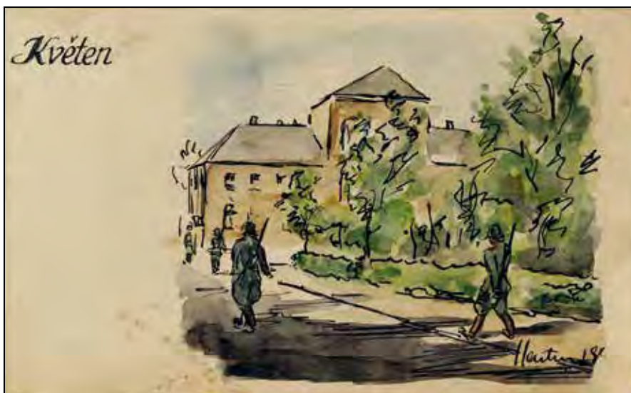
Jan Hartmann, Četnická hlídka v ghettu, 1943–1944. Památník Terezín, PT 14722. © Cyril, Eva a Véronique Hartmanovi.