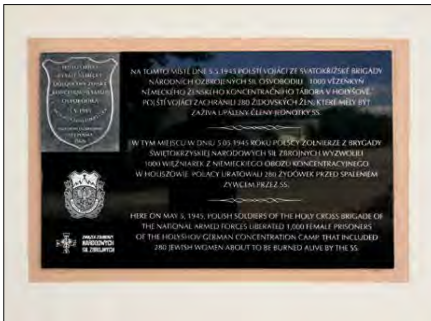
Holýšov-Nový Dvůr – pamětní deska k osvobození tábora.