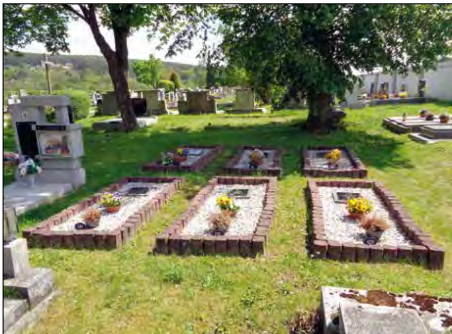
Holýšov – hroby obětí na městském hřbitově.

matická pietní péče, zvláště po roce 2000 velmi intenzivní. Tábor Holleischen proto lze dnes považovat za jednu z nejdůkladněji vzpomínkově ošetřených poboček koncentračního tábora Flossenbürg. Pietní péče je ale věnována také obětem dalších táborů nucené práce v oblasti dnešního Holýšova a obecně událostem druhé světové války. Tento text si proto klade za cíl přednést shrnující zprávu o genezi holýšovských pamětních míst spojených především s pobočkou koncentračního tábora Flossenbürg, ale v základních obrysech také v souvislosti s dalšími tábory a válečným děním.