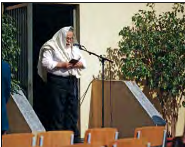
Vrchní zemský rabín Karol Efraim Sidon při tryzně Kever Avot za oběti genocidy Židů z českých zemí na Židovském hřbitově.

V prostoru Židovského hřbitova a na pietním místě u řeky Ohře se konala tryzna Kever Avot za oběti genocidy Židů z českých zemí.