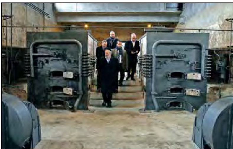
Izraelský ministr vnitra Arje Deri při prohlídce krematoria na Židovském hřbitově.

Památník Terezín navštívil izraelský ministr vnitra Arje Deri.