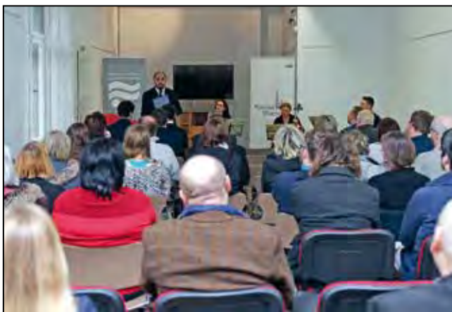
Vzpomínková akce „Pocta Bedrníkovi“. O osudech Zdeňka Bořka-Dohalského přednáší Zdeněk Hazdra, ředitel Ústavu pro studium totalitních režimů.