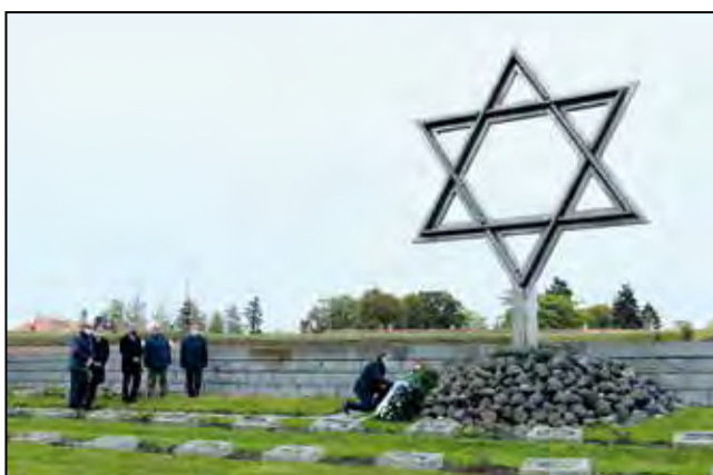
Terezínská tryzna 2020, která se kvůli pandemii nemoci COVID-19 konala až v říjnu a bez účasti veřejnosti.