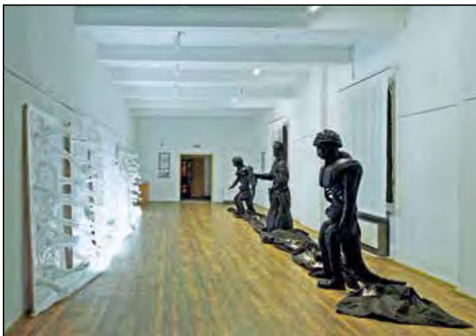
Prostorová instalace „Světlo a stíny“.

V předšálí kina Malé pevnosti byla otevřena prostorová instalace „Světlo a stíny“ vytvořená žáky Střední školy obchodu a služeb Teplice.