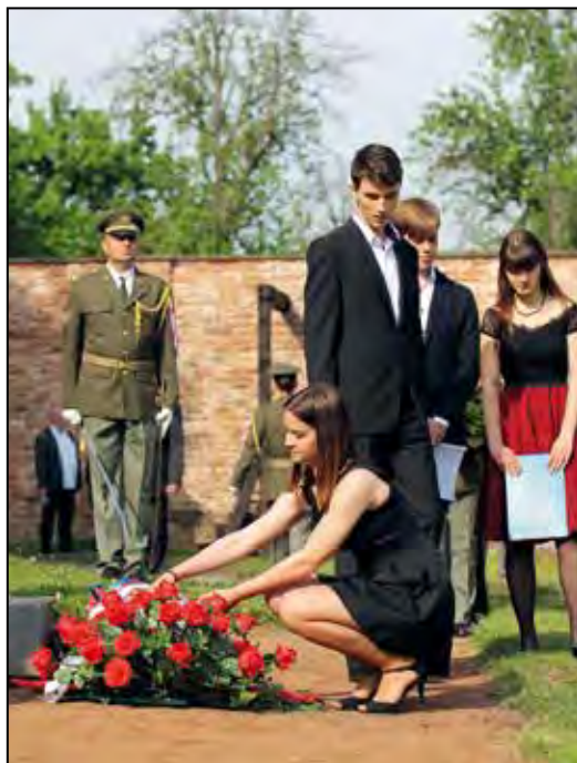
Kladení věnců na popravišti v Malé pevnosti k uctění památky obětí poslední poprav v terezínské policejní věznici 2. května 1945.