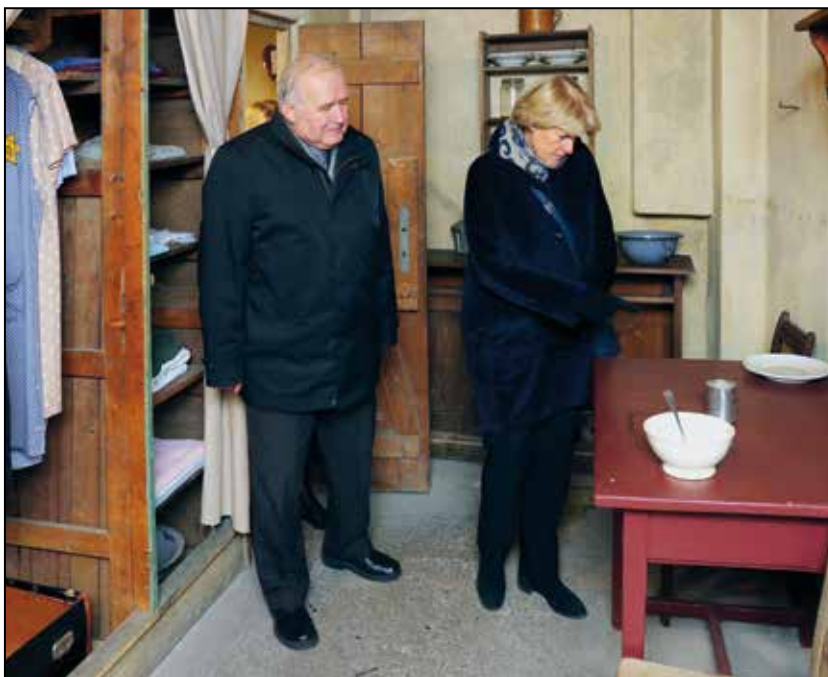
Ministryně kultury Spolkové republiky Německo Monika Grüttersová při prohlídce repliky ubytovacích prostor vězňů terezínského ghetta.

Památník Terezín navštívila ministryně kultury Spolkové republiky Německo Monika Grüttersová.