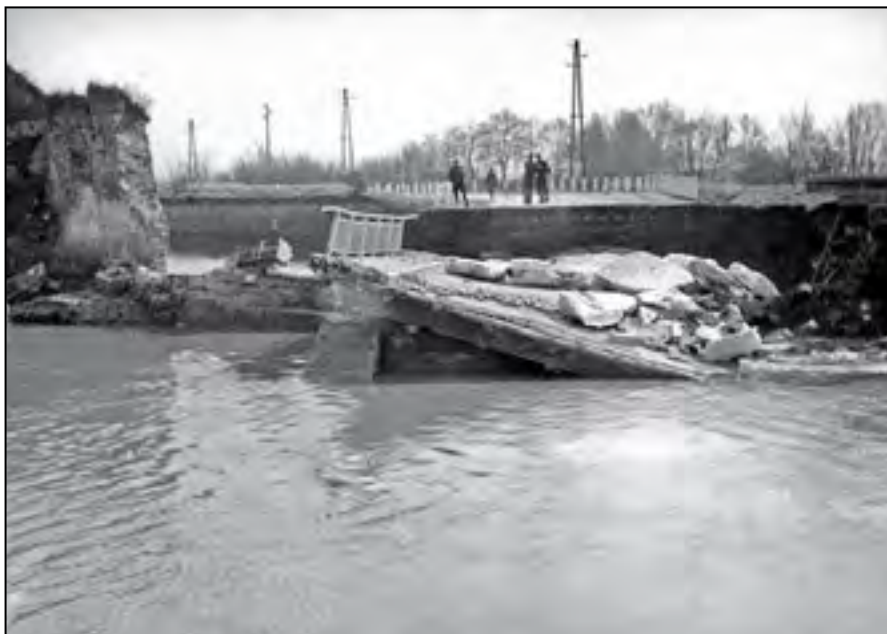
Důsledky povodně, která v březnu 1940 poničila opevnění Malé pevnosti a především silnici do Prahy. Památník Terezín, A 8369.

sahu nápisu uvedl: „Celou dobu, co jsme stáli u zdi, jsem přemýšlel, jak si jej vykládají sami Němci. Vyvodil jsem si z toho pro sebe takovou zásadu, že jsem se vždy chytal každé práce, která se naskytla, abych byl osvobozen.“ 16)