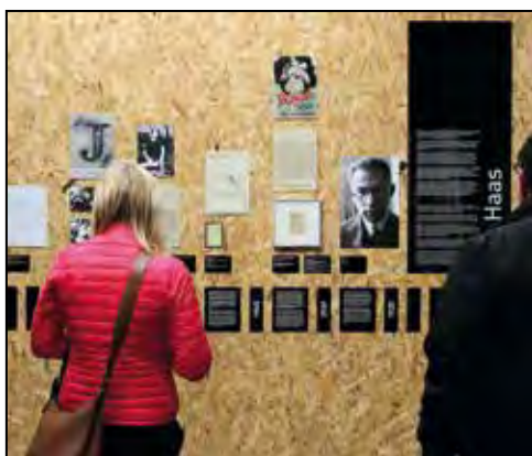
Z vernisáže výstavy „Écraser l'infâme!“.