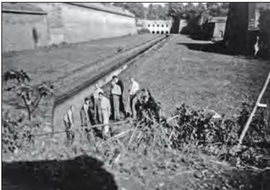
Kanalkommando provádělo čištění kanalizace a stok v Terezíně. Památník Terezín, A 235.