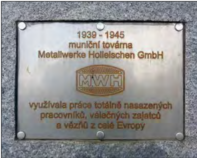
Holýšov – pamětní deska připomínající činnost zbrojovky Metallwerke Holleischen GmbH.

ské zajatce na východním okraji města při ulici Školní; pracovní tábor Německé pracovní fronty při křižovatce ulic Táborová a Sokolovská; pracovní tábor pro totálně nasazené ženy z protektorátu při ulici Zahradní.