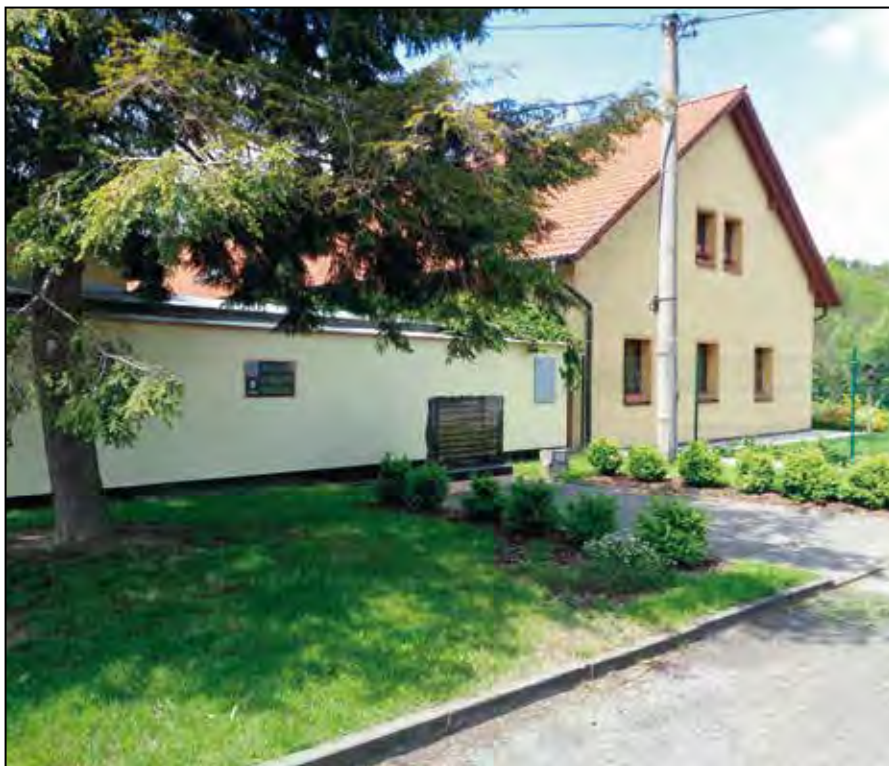
Holýšov-Nový Dvůr – pietní místo.

Úvodní pamětní kámen se nachází v centru Holýšova, v zeleni při křižovatce Jiráskovy třídy a Tovární ulice. Tabulka zmiňuje válečnou zbrojní výrobu ve městě a uvádí tak návštěvníky do sledované problematiky textem: „1939–1945 muniční továrna Metallwerke Holleischen GmbH [logo MWH] využívala práce totálně nasazených pracovníků, válečných zajatců a vězňů z celé Evropy “. Další pamětní kameny připomínají na různých místech Holýšova bývalé táborové kolonie: tábor chorvatských válečných zajatců v zeleni při křížení Jiráskovy třídy s železniční tratí; pracovní tábor pro německé ženy v zeleni vedle nádraží ČD; tábor pro italské zajatce při křižovatce ulic Luční a MUDr. Šlejmara; tábor pro francouzské a sově-