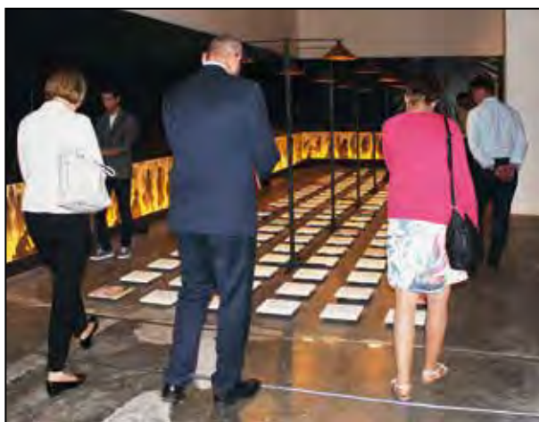
Z vernisáže výstavy „Brémy – Terezín. Cesta s nejistým koncem“.