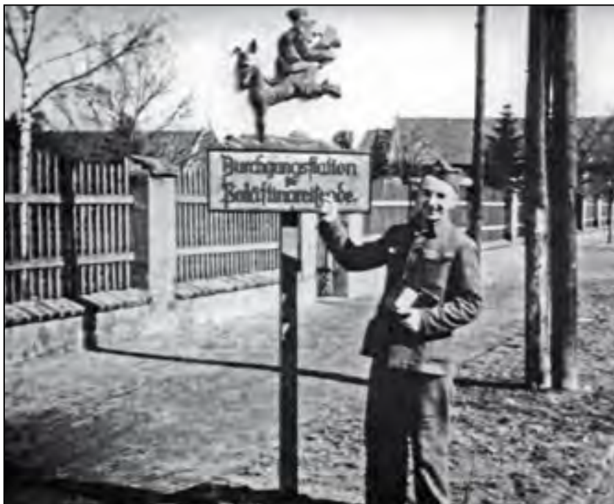
Potupná postava Žida na oslu byla umístěna na hlavním nádvoří Malé pevnosti. Památník Terezín, A 6988.