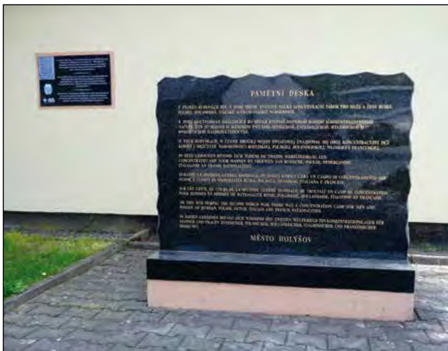
Holýšov-Nový Dvůr – pamětní deska k osvobození tábora.