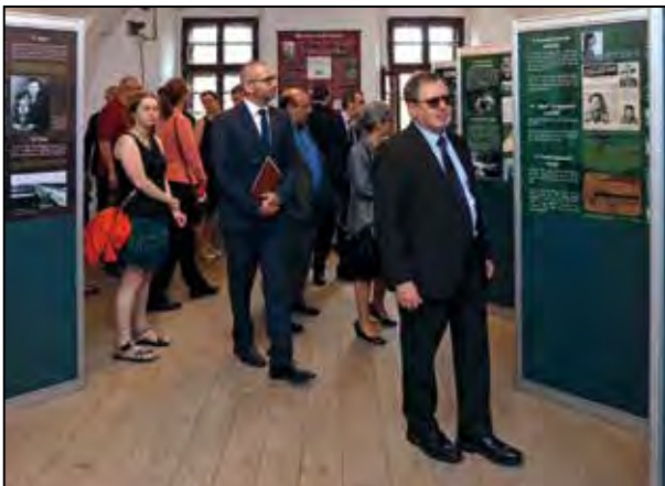
Vernisáž výstavy „Genocida Romů v době 2. světové války“.

Byla zahájena dokumentární výstava Muzea romské kultury v Brně „Genocida Romů v době 2. světové války“ instalovaná ve výstavních prostorách na Ženském dvoře.