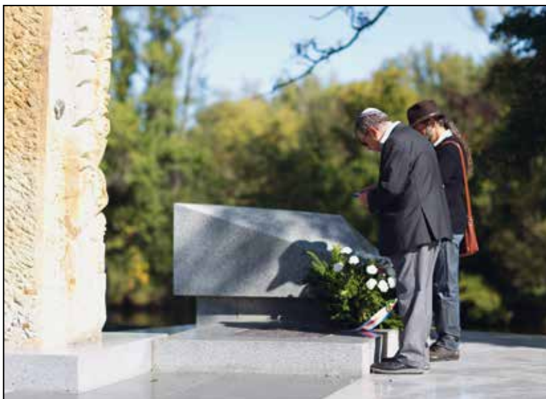
Tryzna Kever Avot za oběti genocidy Židů z českých zemí na pietním místě u řeky Ohře.

Tryzna Kever Avot za oběti genocidy Židů z českých zemí se konala v prostoru Židovského hřbitova a na pietním místě u řeky Ohře.