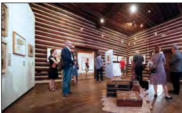
Z vernisáže výstavy „Terezínské kontemplace“.