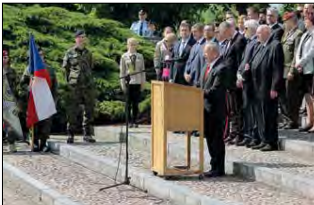
Tereziánská tryzna 2019, hlavní projev předsedy Senátu Parlamentu ČR Jaroslava Kubery.