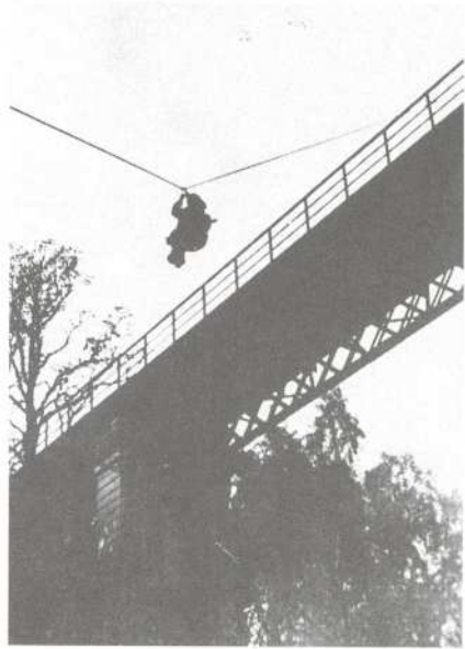
Z výcviku československých parašutistů ve Velké Británii