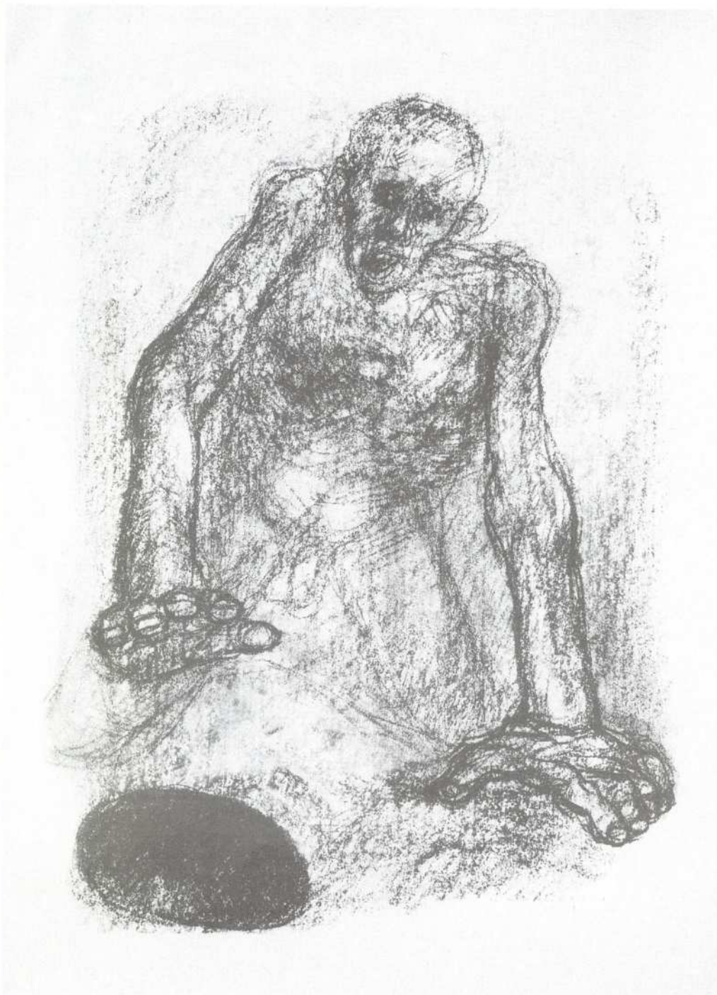
Selma Waldmanová: Z cyklu Zápás o přežití