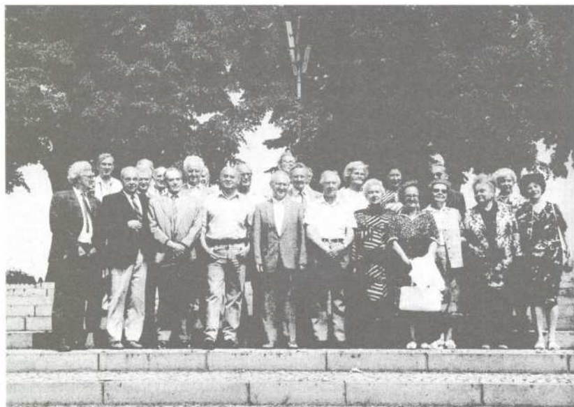
Roudničtí studenti při setkání v Terezíně r. 1992