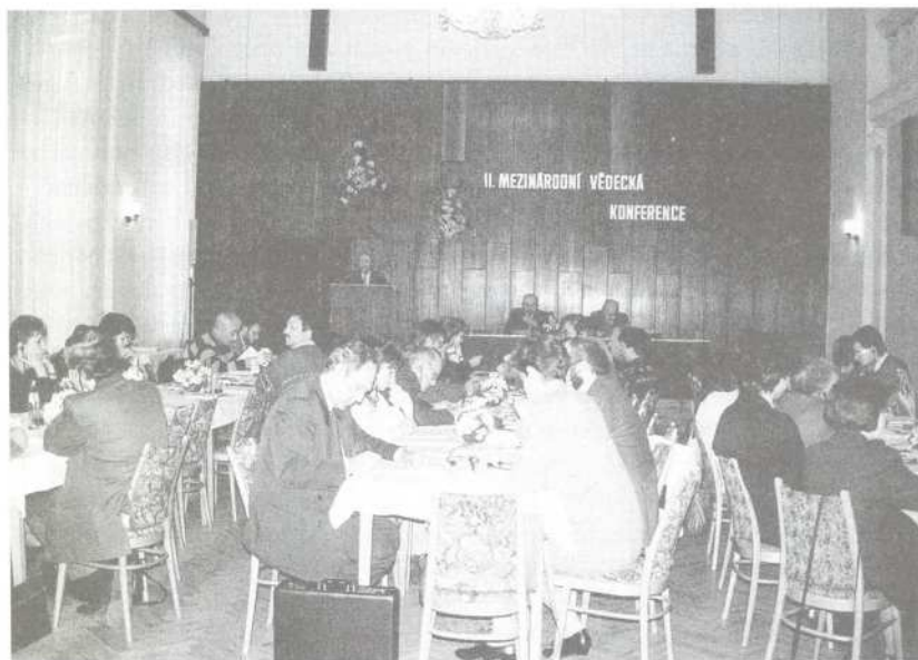
Pohled do jednacího sálu Posádkového domu armády v Terezíně, kde probíhala mezinárodní vědecká konference na téma „Vernichtung durch Arbeit“