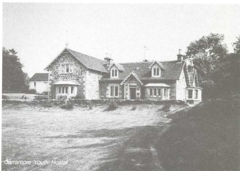
Farma Garramore v severním Skotsku, kde probíhal základní výcvik československých dobrovolníků