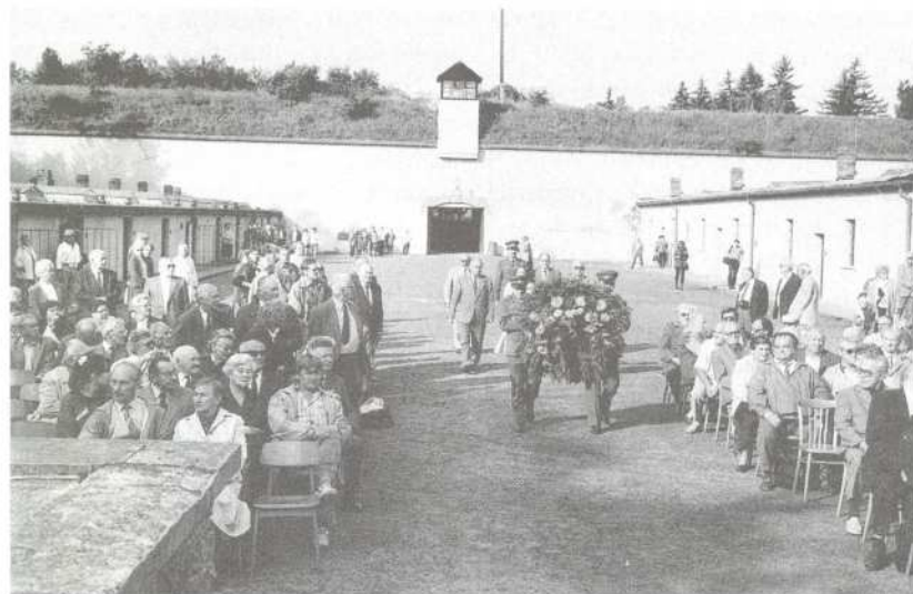
Zahájení slavnostního setkání bývalých vězňů v Malé pevnosti